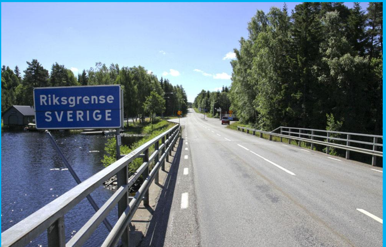
Und wieder nach Schweden.