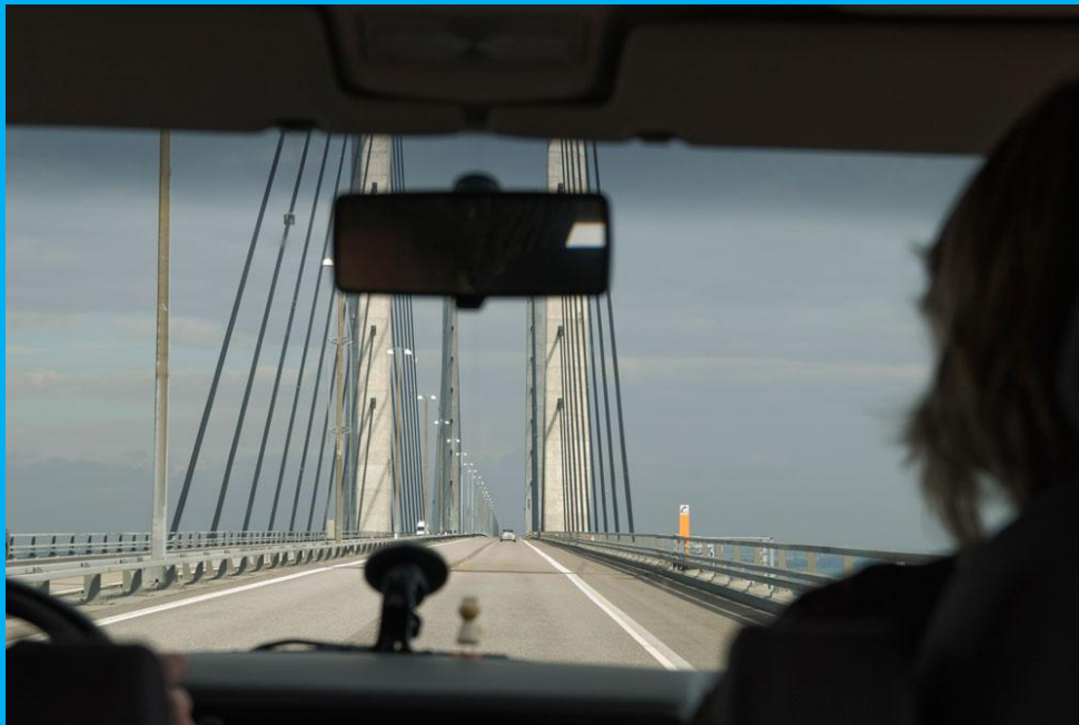
- bei Kopenhagen weiter über die Öresundbrücke nach Malmö -