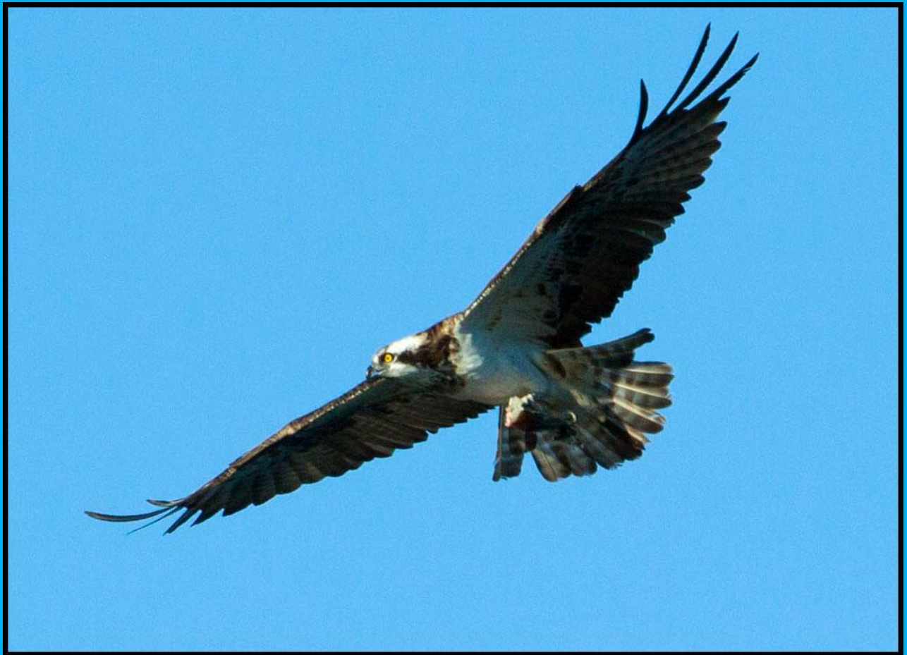
Fischadler in Natura (Foto frei Hand aus dem Schlauchi)