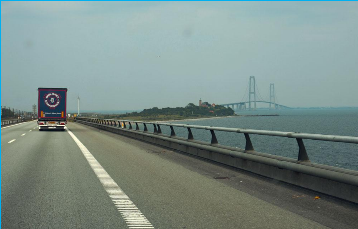
- nach Odense über die Storebæltbrücke -