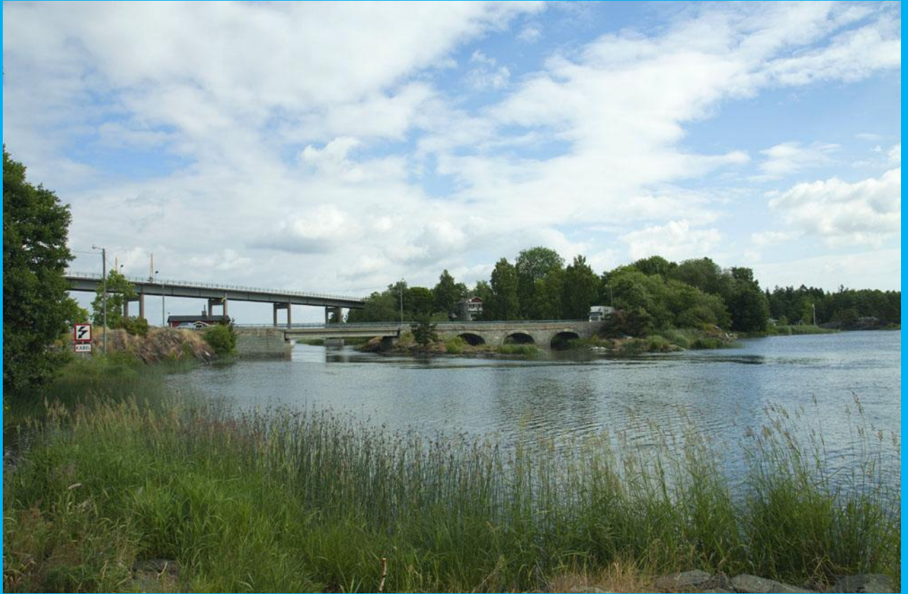
Bilder vom Amminen