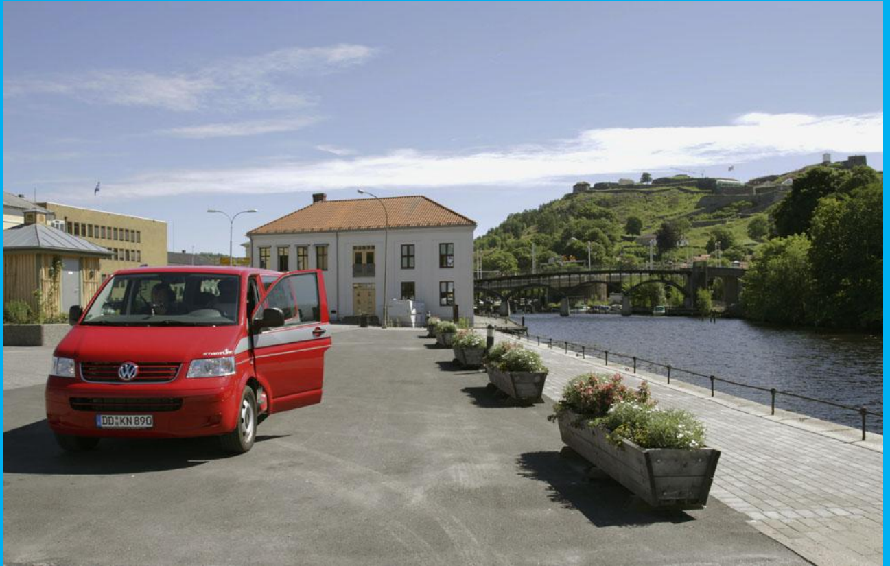
Im Hintergrund die Festung „FREDERIKSTEN“